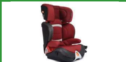
Автокресло группы III для детей массой 22-36 кг (возможно использование бустера)