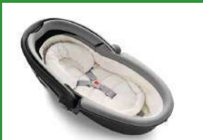
Автокресло «люлька» группы 0 для детей массой менее 10 кг

Детские удерживающие устройства подразделяют на 5 весовых групп: