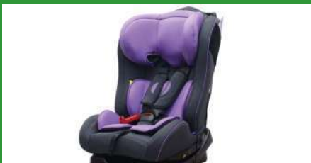
Автокресло группы II для детей массой 15-25 кг